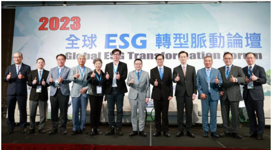
ESG企業論壇登場 凱基證聚焦永續發展

6.凱基證券和 IR Trust 於 2023 年 9 月主辦台灣最大規模「全球 ESG 企業永續經營轉型脈動論壇」，現場除吸引超過 300 家上市櫃公司董總及高層和 100 位以上國內外專業機構投資法人出席參加，更是台灣史上首度聚集中菁會、磐石會、億載會、港都會、桃園會和義雲會，串聯從北到南六大上市櫃企業聯誼會共同協辦的大型活動，總計掛牌公司占台股總市值達新台幣近 2 兆元。